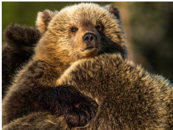
Björnunge busar med sitt syskon.

Myren är väldigt vacker och stor. Du kommer att få möjligheter till både närgångna porträtt av björn men även miljöbilder (landscapsbilder med björn). Tajgan här lyfter givetvis känslan att vara i ett landskap där björnarna trivs. I slutet av maj blir det aldrig riktigt mörkt här och den öppna myren ger