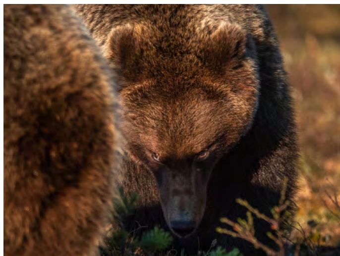
kommer att vara gemensamma. En björnhane utmanar en annan björn framför gömslet.

Däremot tycker jag att det är viktigt att du som deltagare om du vill kan få gå din egen väg och hitta de motiv du vill fotografera. En del fotografer fungerar bäst i grupp och andra fotografer vill helst fotografera och söka upp sina motiv själva.