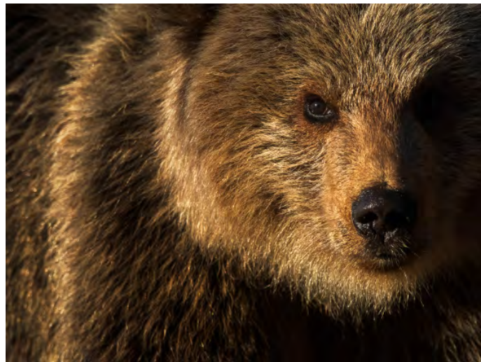
Kom riktigt nära björnen!

Förutom dessa gömslen kommer vi också att sitta i ett björngömsle med mer lokal anknyt-