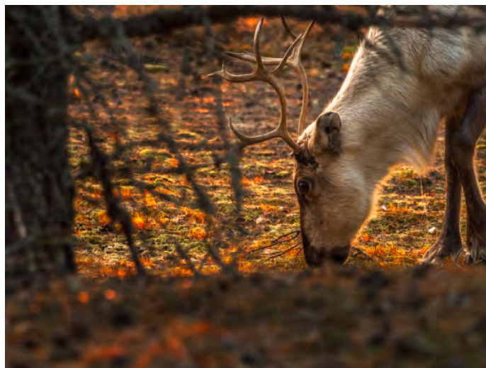
Renar är en vanlig syn här i lappländska Finland.

Vi kommer inte att göra några längre vand-