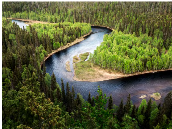
Soca rinner som en pulsåder genom Trenta dalen.

Enklast och smidigast för dig som ska köpa flygbiljetter är att kontakta din personliga kontakt på Big Travel som du får när du bokar en fotoresa via Fröstad Naturfoto. Läs mer om detta nedan.