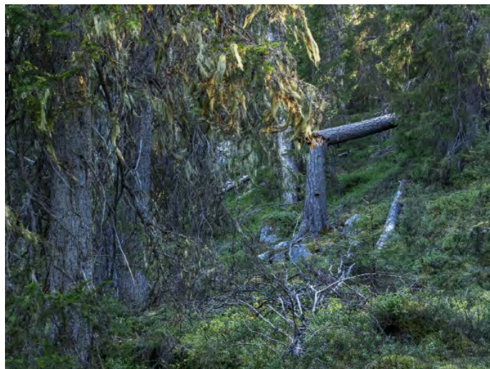
Parat och ingår i Hossa nationalpark.

20 maj: Inga måltider ingår. Middag äts på kvällen.